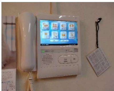
ナースコール親機(3台)