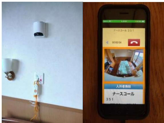
見守りカメラの映像をスマホで確認