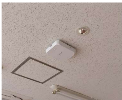
無線LANアクセスポイント(48台)